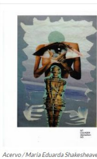
Acervo / Maria Eduarda Shakesheave.

As colagens de Maria Eduarda Shakesheave são mergulhos nas profundezas das relações humanas em que a artista nos convida a fazer a fim de buscar aquilo que se perdeu.